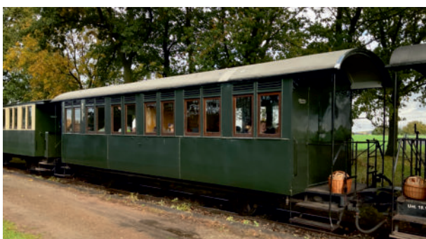
Wagen 57 bei der Halloween-Fahrt am 28.11.23 in Stahe