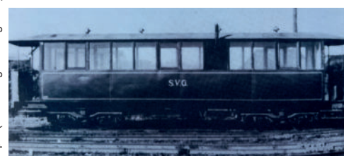
Wagen 119 mit Ofenrohr im verschlossenen Fensterfeld auf Sylt