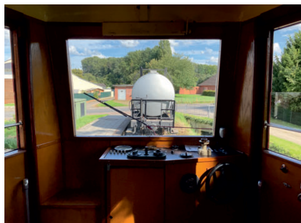
Kesselwagen 1002 in Schierwaldenrath am 30.06.2023.