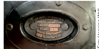
Kesselschild Lok 21, Kessel sitzt seit 2022 auf Lok 20