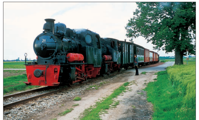
Lok 21 und 19 in Doppeltraktion am Hp Gelindchen