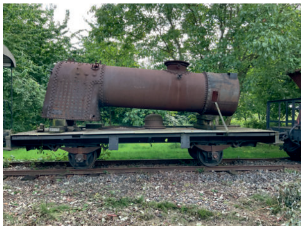
Kessel der 21 Nr. 12703 (ex 19) verladen auf Wagen 12